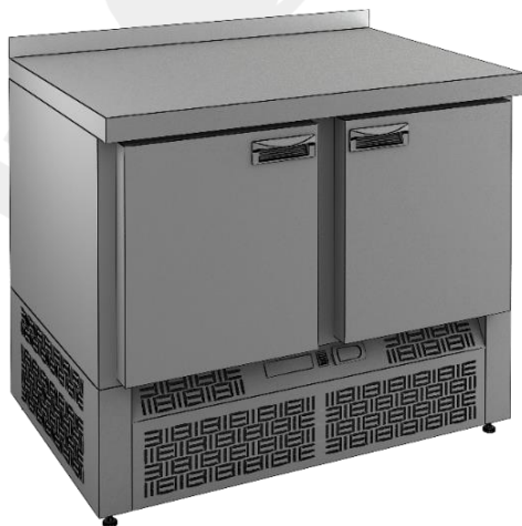
Рис.1 Стол охлаждаемый 2х дверный GNE 11 TN