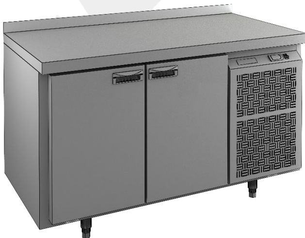
Рис.1 Стол охлаждаемый 2х дверный GN 11 TN