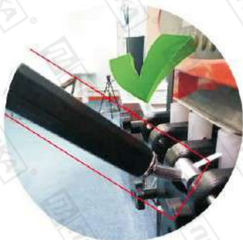
Правильное положение ручки