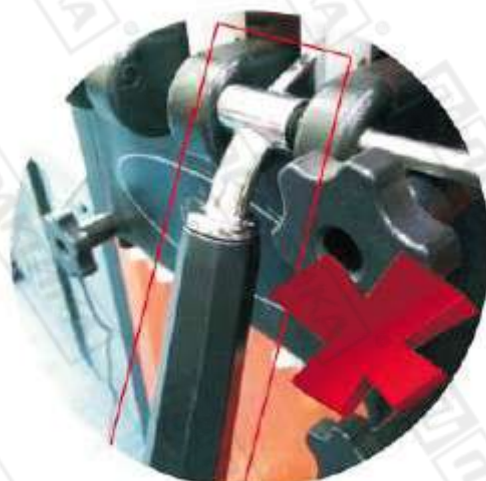
Неправильное положение ручки