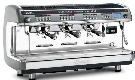
Tall cup version