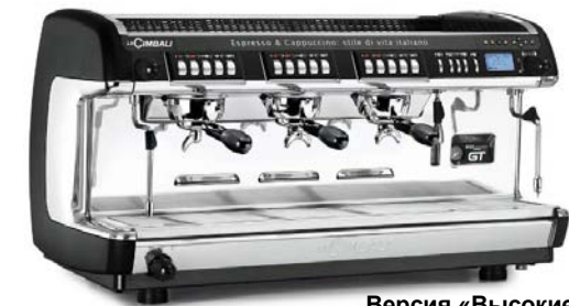
Версия «Высокие стаканы»