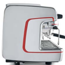
полированный алюминий (опция)