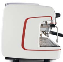
Нерж. сталь & белая эмаль

Цвета: нержавеющая сталь & матовый ЧЕРНЫЙ