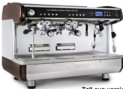
Tall cup version