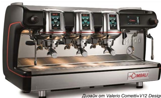
Дизайн от Valerio Cometti+V12 Design

Цвета: нержавеющая сталь & матовый ЧЕРНЫЙ